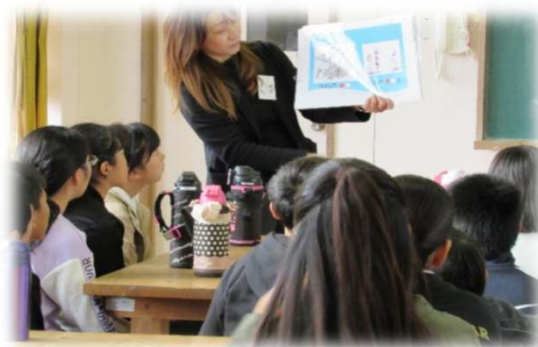
働くことの楽しさ・喜びについて説明