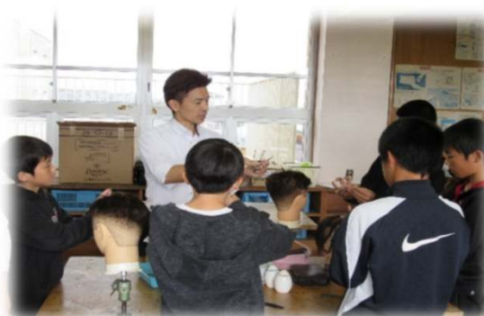
ハサミの持ち方とカット体験①