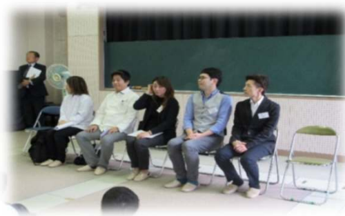
本日の講師紹介及び挨拶