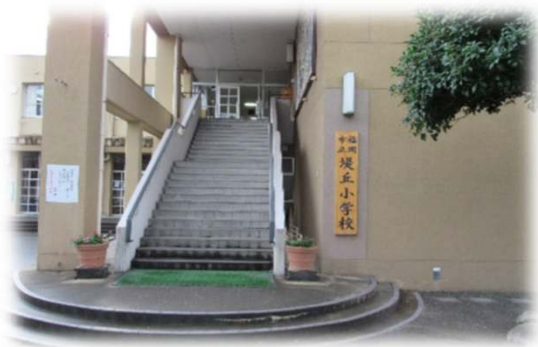
福岡市立堤丘小学校