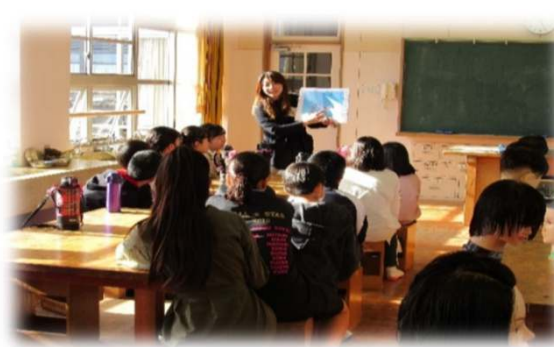
理容師(免許取得からお店を出すまで)