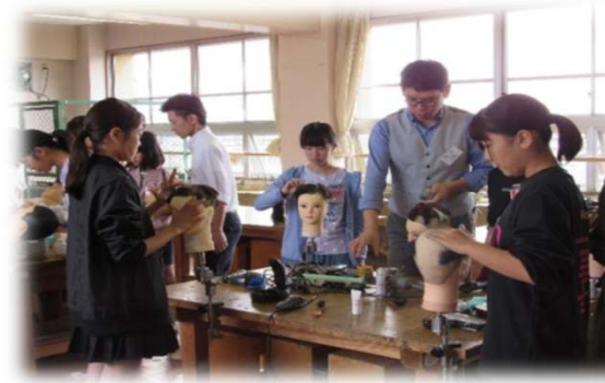
ハサミの持ち方とカット体験②