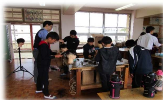
理容は美しさ・清潔さをモットに