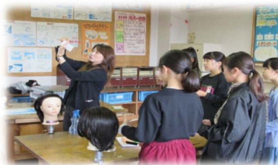
色彩(色使い)について説明