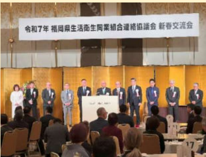
昨年度の新春交流会

新春交流会 1月26日(月) オリエンタルホテル福岡 (これまでの会場から変わります。)